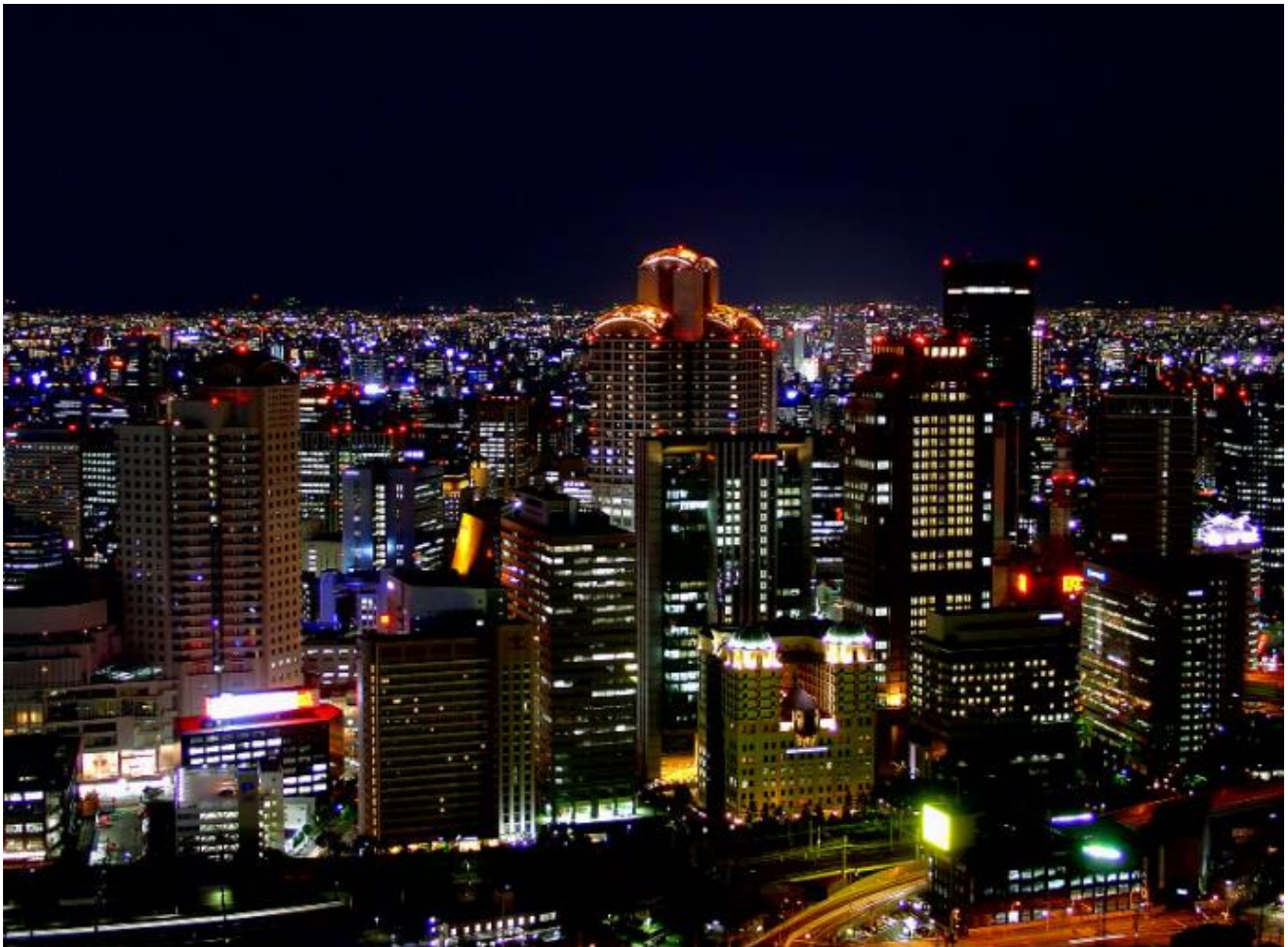
Nachtzicht vanaf Umeda Sky Building

Architect(en): Hiroshi Hara Hoofdaannemer: Takenaka Obayashi Kajima Asunaro Aoki Gemeenschappelijke onderneming