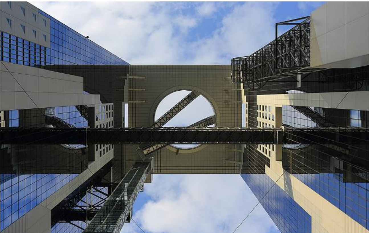
Bekijk omhoog kijkend