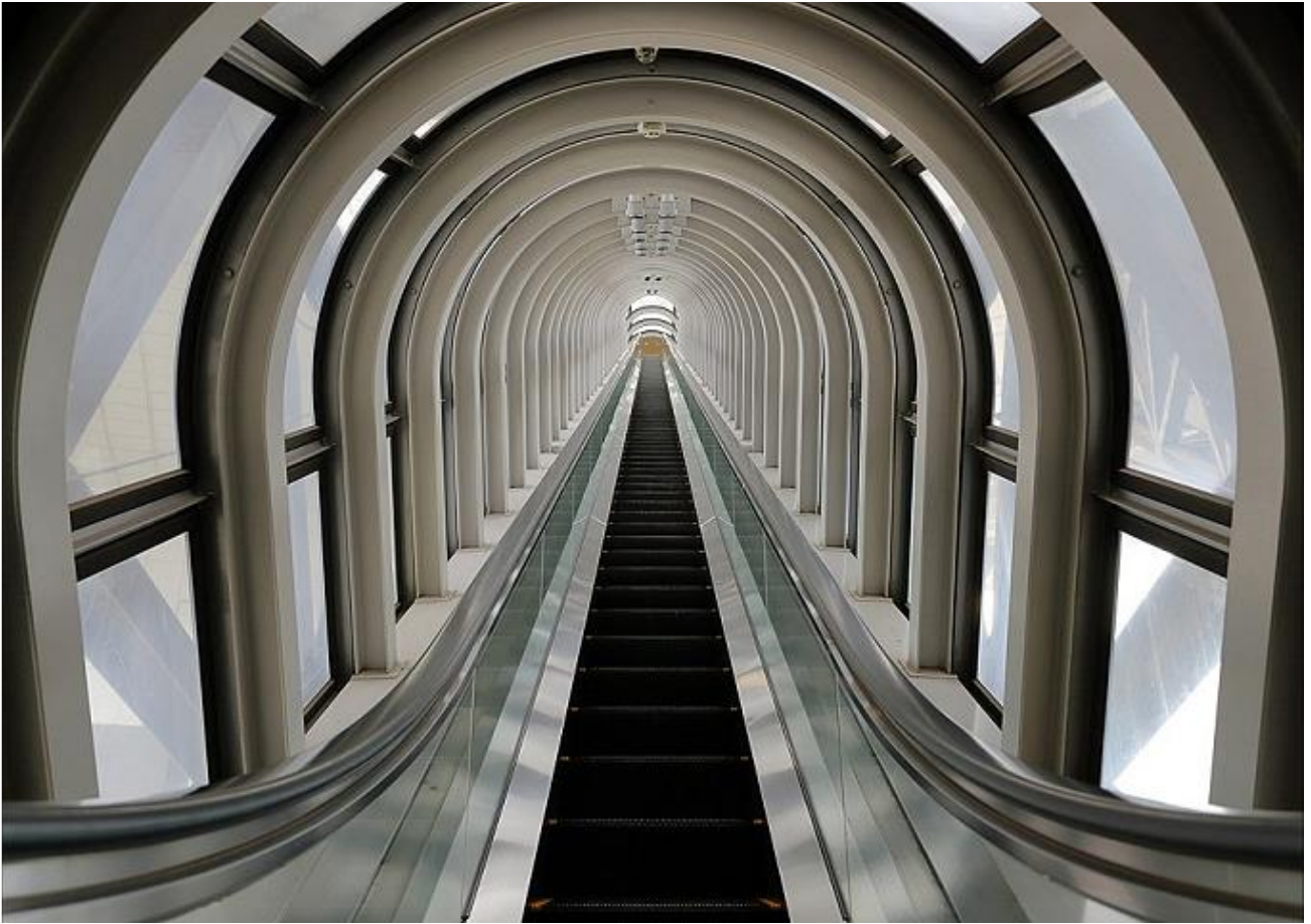
De roltrap die de brede atriumachtige ruimte doorkruist